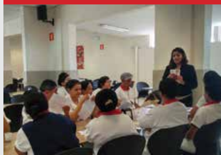
Empresa Massima, unidade Continental Tevês