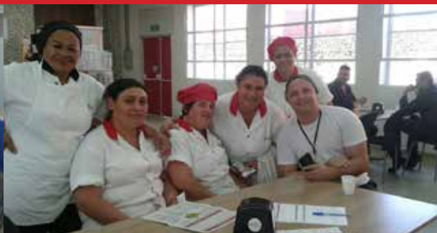
Empresa Massima, unidade Continental (Salto)