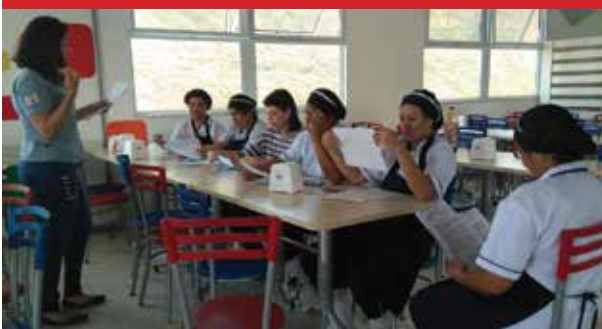
Empresa Evita, unidade Log (Jundiaí)