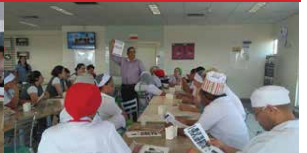
Empresa LC alimentacao, unidade Siemens (Jundiaí)