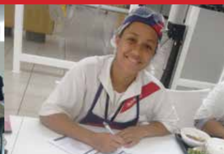
Sodexo .Avon (Cabreúva)