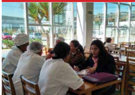
Empresa GRSA, unidade Thera Park 5