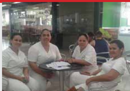
Empresa Log Serv, unidade Pão de Açúcar (Itu)