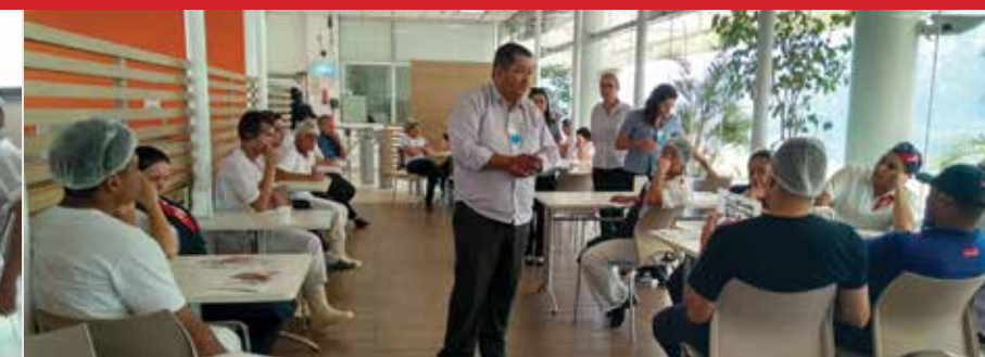
Empresa Sodexo, unidade da Natura (Cajamar)