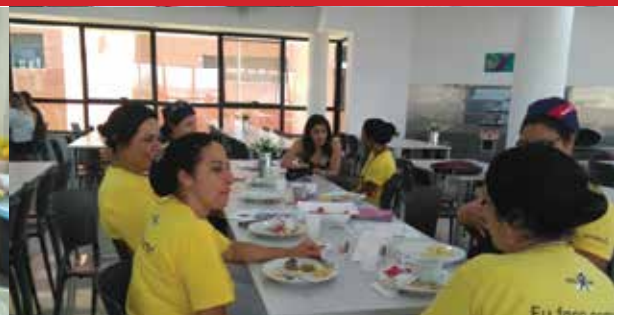
Empresa Sodexo, unidade Henkell