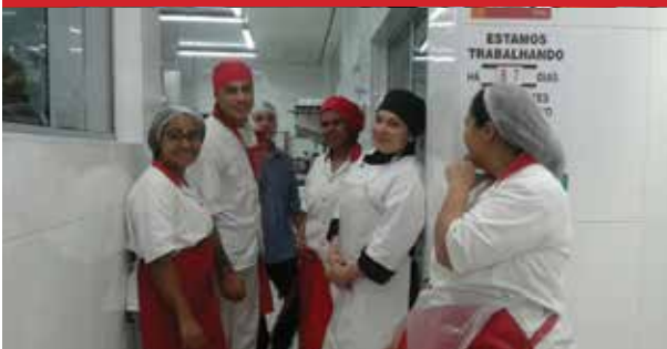
Empresa Máxima, unidade TMD Salto