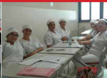
Empresa Nutriplus, EMEF Prudente de Moraes