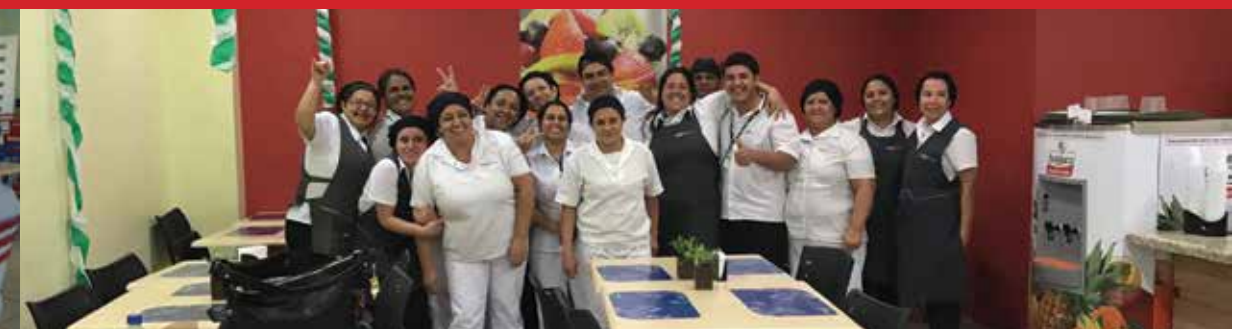
Primeira reunião turno A, Hospital Novo Atibaia, Empresa GR