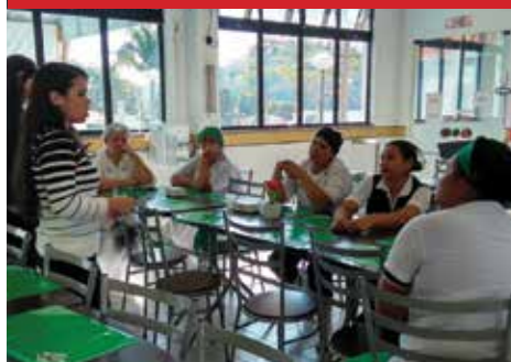
Empresa Lallegra unidade Ceratti