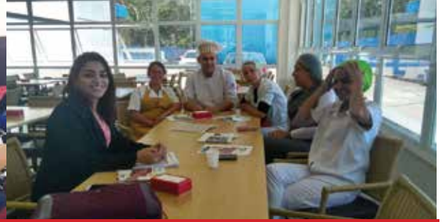
Empresa LC Alimentação, unidade Donaldson