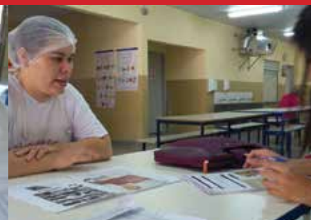
Empresa Log Serv, unidade Pão de açúcar Itu