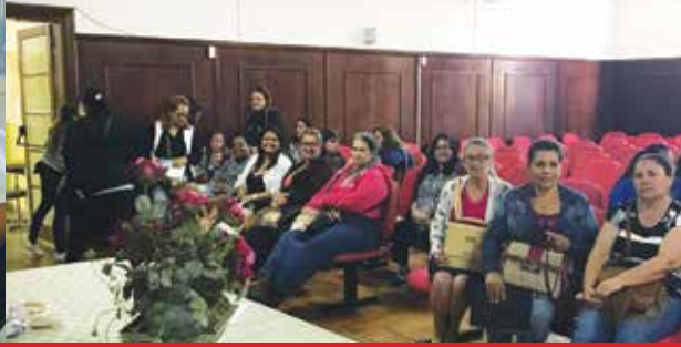
Empresa WF Cozinheiras Escolares de Bragança Morungaba e Tuiuti