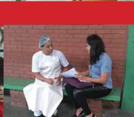
Escola Estadual de Várzea Paulista, Tanaka