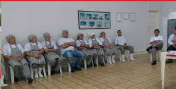
Empresa Splendido, unidade El Ekeiros (Várzea Paulista)