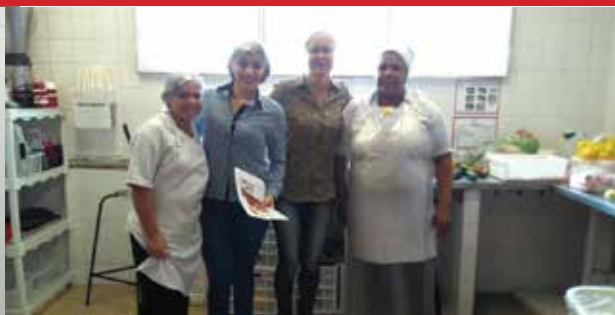
Empresa LC alimentacao, unidade Roldão (Franco da Rocha)