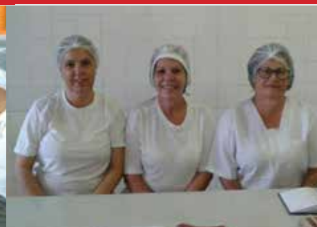
Empresa Sunny, unidade Escola Leonor (Salto)