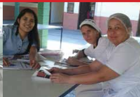
Empresa Qualy, unidade Escola Zezito