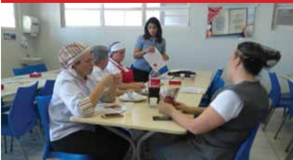
Empresa C L Alimentação, unidade Eternit (Atibaia)