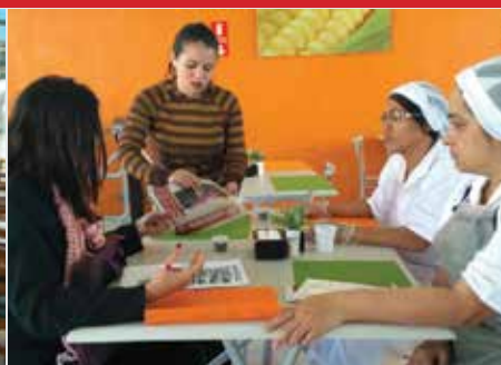
Empresa Mon Ville, unidade Fiação Fides 2