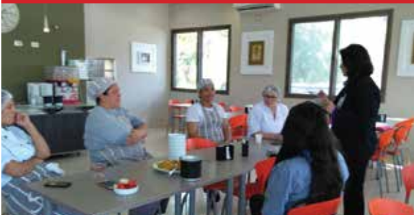
Empresa Splendido unidade Balluf (Vinhedo)