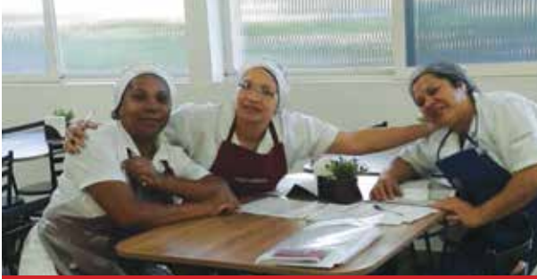
Empresa Cucinare, unidade Imerys (Salto)